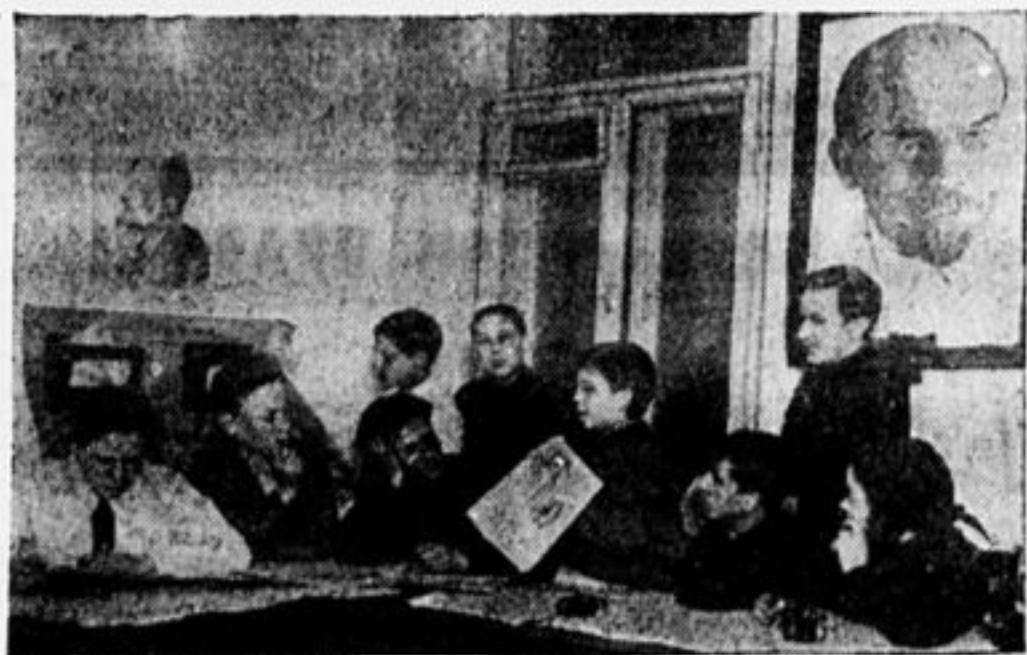
Широкая редколлегия за разбор номера.

В работе редколлегии IV созыва были и недочеты. Во-первых, был ограниченный состав ее. Не было представителей от Москов-