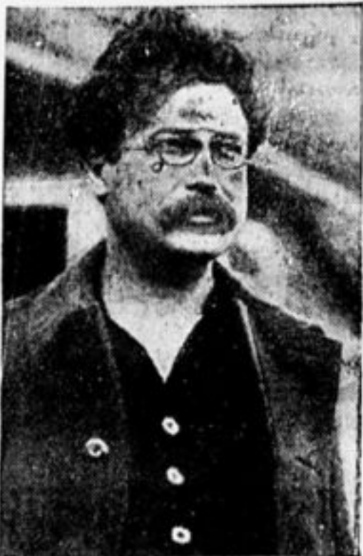
Тов. Ем. Ярославский.

«Пионерская Правда» за год добилась 50-тысячного тиража. Это пока еще маленький успех. Но это уже много для начала. Пионер имеет свою газету, ко-